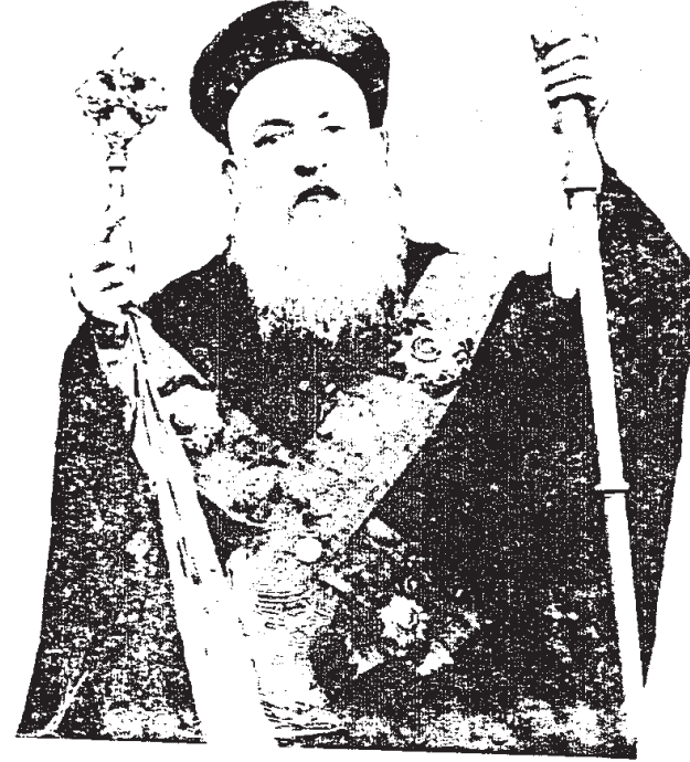
ಮೊರಾರ್ಜಿ ದೇಸಾಯಿ ಅವರು (ಅಂತರರಾಷ್ಟ್ರೀಯ ಪತ್ರಿಕಾರ್ಕರರು.)